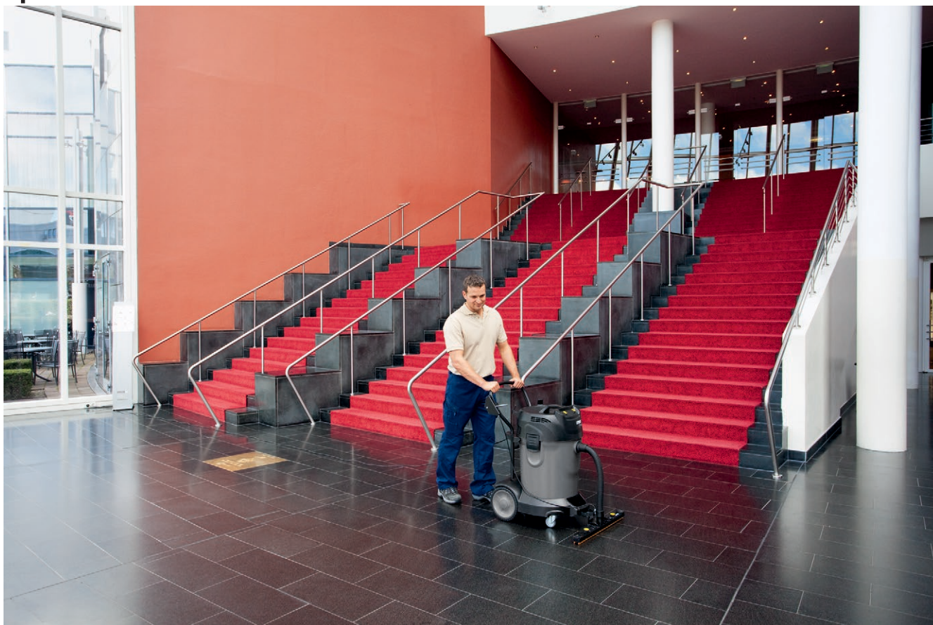
NT 70/2 Adv